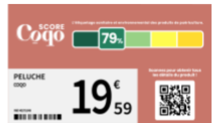
Exemple d’affichage du Coqo Score en magasin